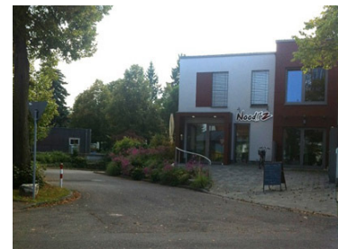
Einfahrt zur Tiefgarage